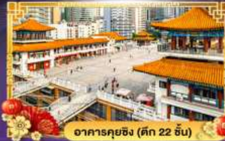
อาคารคุยซิง (ตึก 22 ชั้น)