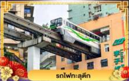
รถไฟฟ้า-ลู่ติง