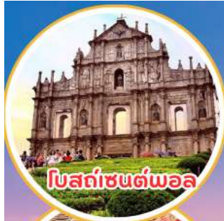
โบสถ์เซนต์สปอล