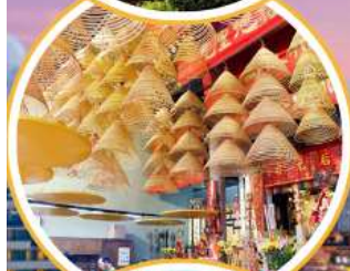
ไหว้พระวัดดั่ง