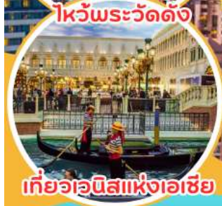
เที่ยวอเวนิสแห่งเอเชีย