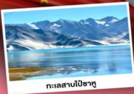
ทะเลสาบไปซาทุ

เปิดประตูสู่อารยธรรมพันปีแห่งซินเจียงใต้ ชมความสวยงามของหมู่บ้านดอกแอปเปิ้ล