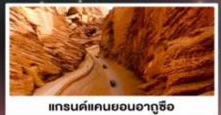
แกรนด์แคนยอนอาตุซื่อ