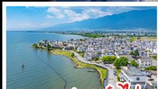
ทะเลสาบเอ๋อไห่