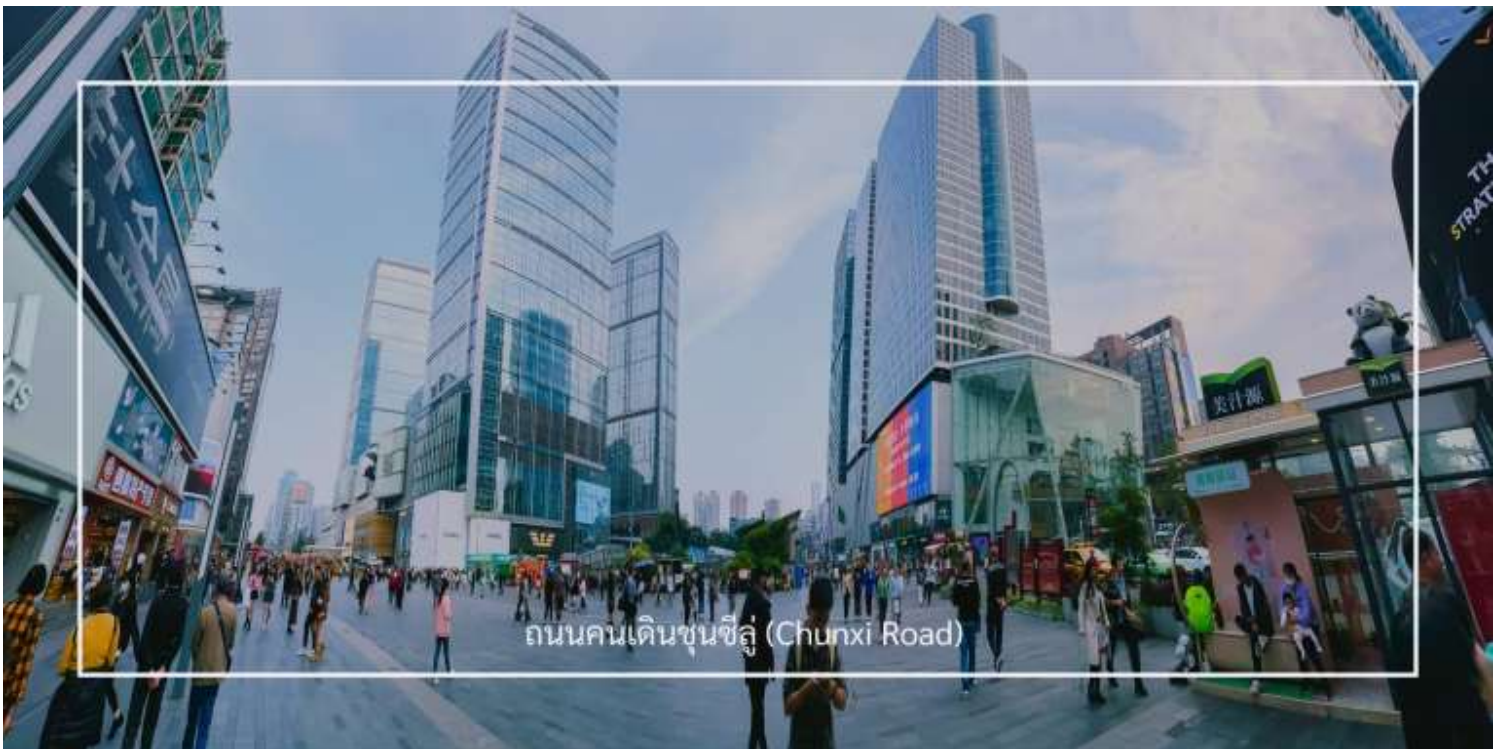
ถนนคนเดินชุนซีลู่ (Chunxi Road)

เดินข้ามถนนมาอีกหน่อย ท่านจะได้ช้อปปิ้ง ถนนคนเดินชุนซีลู่ (Chunxi Road) เต็มไปด้วยร้านค้าแบรนด์ชั้นนำทั้งในและต่างประเทศ รวมถึงร้านเสื้อผ้าแฟชั่น รองเท้า อุปกรณ์อิเล็กทรอนิกส์ และของฝาก ถนนคนเดินชุนซีลู่เป็นจุดที่มีความคึกคักและเต็มไปด้วยผู้คน โดยเฉพาะในช่วงวันหยุดสุดสัปดาห์และเทศกาลต่างๆ คุณจะพบกับการแสดงศิลปะ การแสดงดนตรี และกิจกรรมที่น่าสนใจ มีร้านอาหารมากมายที่เสิร์ฟอาหารท้องถิ่นและขนมหวานที่หลากหลาย นักท่องเที่ยวสามารถลิ้มลองเมนูพื้นเมืองที่อร่อย เช่น เสี่ยวหลงเปา (ซาลาเปาเนื้อ) หรือขนมโบราณตามรอยซีรีส์ยี่จิ้นอย่าง มาโลโกว ก็มีเช่นกัน