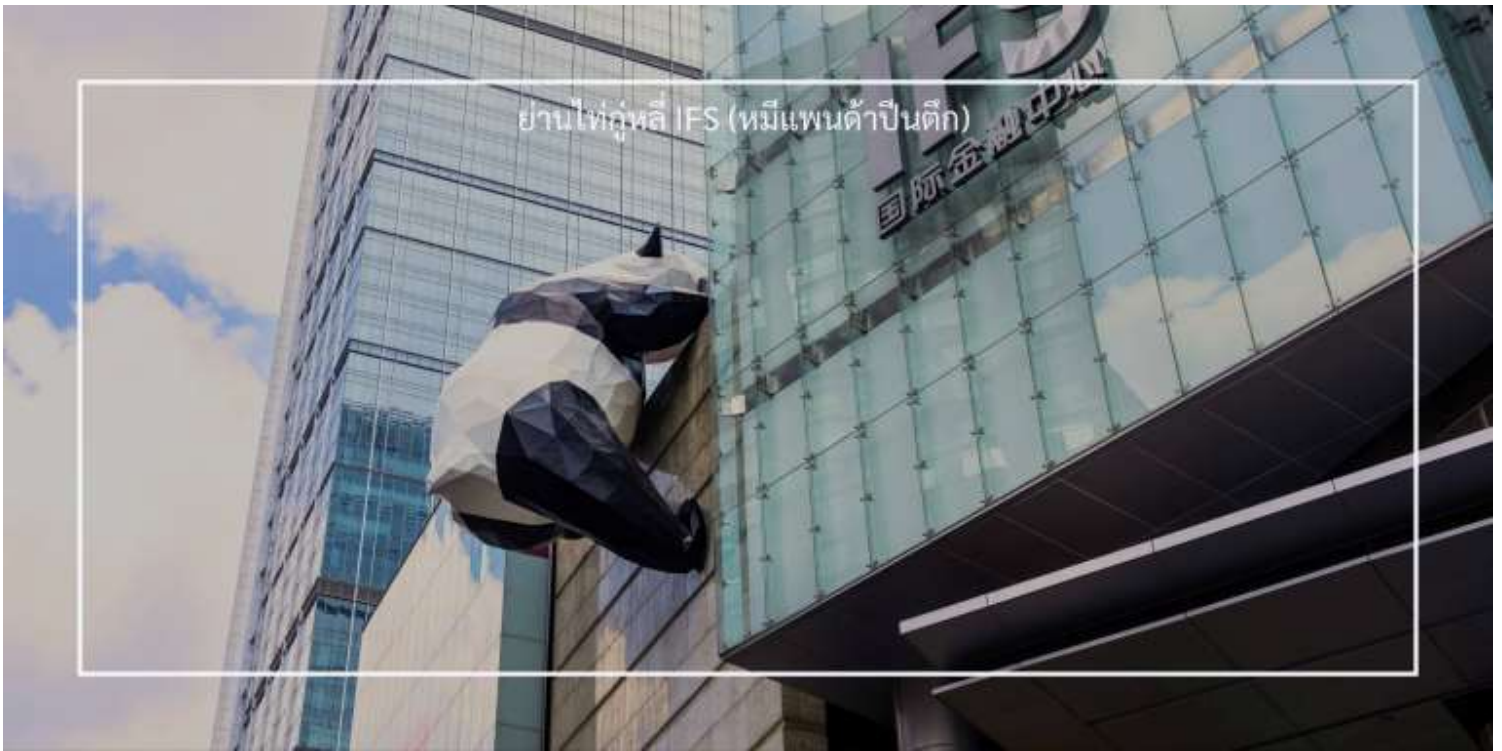
ย่านไท่กู่หลี่ IFS (หมีแพนด้าป็นดึก)

เดินข้ามถนนมาอีกหน่อย ท่านจะได้ช้อปปิ้ง ถนนคนเดินชุนซีลู่ (Chunxi Road) เต็มไปด้วยร้านค้าแบรนด์ชั้นนำทั้งในและต่างประเทศ รวมถึงร้านเสื้อผ้าแฟชั่น รองเท้า อุปกรณ์อิเล็กทรอนิกส์ และของฝาก ถนนคนเดินชุนซีลู่เป็นจุดที่มีความคึกคักและเต็มไปด้วยผู้คน โดยเฉพาะในช่วงวันหยุดสุดสัปดาห์และเทศกาลต่างๆ คุณจะพบกับการแสดงศิลปะ การแสดงดนตรี และกิจกรรมที่น่าสนใจ มีร้านอาหารมากมายที่เสิร์ฟอาหารท้องถิ่นและขนมหวานที่หลากหลาย นักท่องเที่ยวสามารถลิ้มลองเมนูพื้นเมืองที่อร่อย เช่น เสี่ยวหลงเปา (ซาลาเปาเนื้อ) หรือขนมโบราณตามรอยซีรีส์ยี่จิ้นอย่าง มาโลโกว ก็มีเช่นกัน