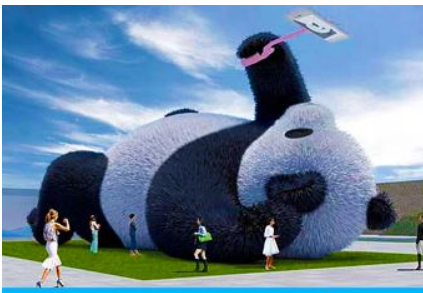
ตุ๊กตาแพนด้าเชลฟี

เที่ยง รับประทานอาหารกลางวัน ณ ร้านอาหารพื้นเมือง (5) หลังอาหารนำท่านเดินทางสู่ เมืองตูเจียงเยียน 都江堰 (ระยะทาง 234 กม. ใช้เวลาเดินทางราว 4 ชั่วโมง) ระหว่างเดินทางท่านสามารถชมทัศนียภาพธรรมชาติอันงดงามของสองข้างถนนขณะที่รถแล่นผ่าน ที่มีทั้งภูเขาหิมะสูง หุบเขา ธารน้ำ และทุ่งหญ้าบนที่ราบสูง หรือพักผ่อนตามอัธยาศัยบนรถระหว่างเดินทาง