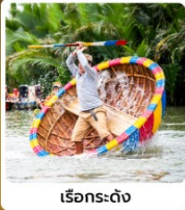
เรือกระดง