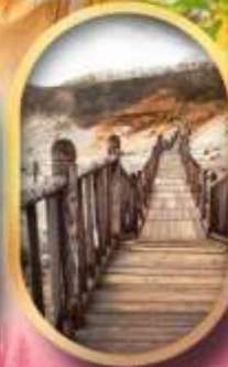
หุบเขาจโกกุคาบิ