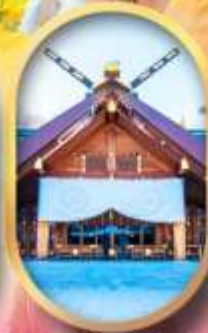
ศาลเจ้าซอกโกโต