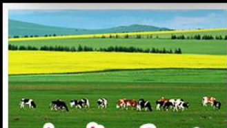
ทุ่งหญ้าฮอร์ดอส

ทุ่งหญ้าฮอร์ดอส สุสานเจกิสข่าน แกรนด์แคนยอนแม่น้ำเหลือง