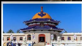
สุสานเจกิสข่าน