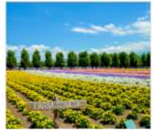
ทุ่งลาเวนเดอร์โทมิตะ