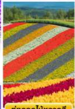
ทุ่งดอกไม้หลากสี