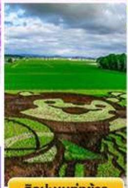
ศิลปะบนทุ่งข้าว