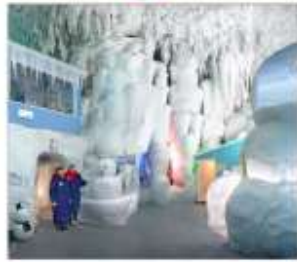
พิพิธภัณฑ์น้ำแข็ง