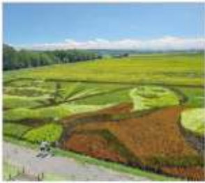
ศิลปะบนทุ่งนา