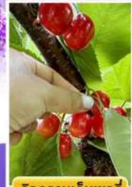
กิจกรรมเก็บเชอร์รี่

☁️ ออนเซ็น 2 คืน 🧳 นน.กระเป๋า 23 กก. 1ใบ ☀️ 6Days 4Night