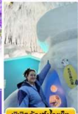
พิพิธภัณฑ์น้ำแข็ง