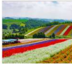
ทุ่งดอกไม้หลากสี