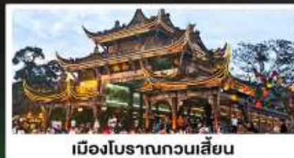
เมืองโบราณกวนเสียน