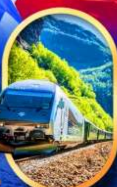
รถไฟฟลิมสขาน่า