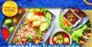
อาหารไทย ในเดนมาร์ก