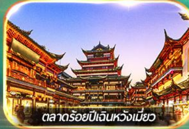
ตลาดร้อยปีเงินห้วงเมี่ยว