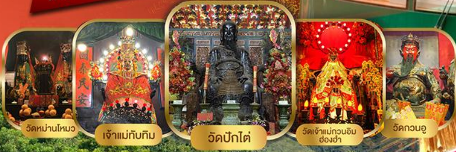
วัดบ้านโสมง

ไหว้พระเสริมดวงแบบจัดเต็ม รวมขึ้นพีคแกรม