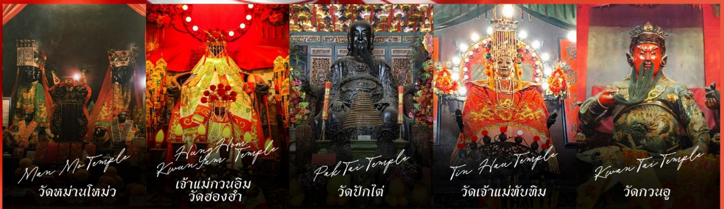
Man Mo Temple วัดม่านไหม่

รายการทัวร์ข้างต้นอาจมีการปรับเปลี่ยนเพื่อความเหมาะสม