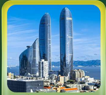
“ตึกแฝดเซี่ยะเหมิน”

T2G-XMN01MF เซี่ยะเหมิน หย่งตั้ง บ้านดินตุ๋โหลว เกาะกู่ลิ่งอวี 5D 4N (MF)