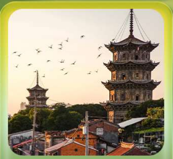
“เมืองโบราณฉวนโจ้ว”