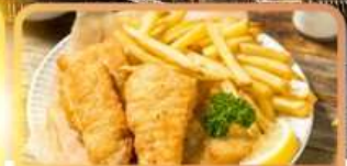
Fish and Chips