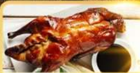
เปิด Four Season