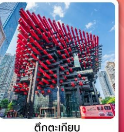
ตึกตะเกียบ

ไฮไลท์! เที่ยวอุทยานแห่งชาติหลุมบ่อฟ้า มรดกโลกระดับ 5A ชมรถไฟฟ้าทะลุถ้ำ อลังการแสงสีที่หงหยาดัง