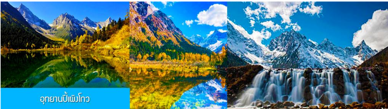
อุทยานบี๋เผิงโกว

หลังอาหารนำท่านเที่ยวชม อุทยานบี๋เผิงโกว 毕鹏沟景区 ที่เป็นแหล่งท่องเที่ยวธรรมชาติที่สวยงามได้รับฉายาว่าเป็นสวิตเซอร์แลนด์แดนใต้แห่งเมืองเสฉวน ตั้งอยู่เหนือระดับน้ำทะเลระหว่าง 2,015 เมตร – 3,500 เมตร ครอบคลุมพื้นที่ 614 ตารางกิโลเมตร ได้รับการขึ้นทะเบียนเป็นอุทยานท่องเที่ยวธรรมชาติระดับ 4A ของจีนในปี ค.ศ. 2013 และกลายเป็นอุทยานท่องเที่ยวยอดเยี่ยมที่มีนักท่องเที่ยวเดินทางมาเยือนในปี 2023 ...นำท่านขึ้นรถบัสของอุทยานเพื่อเข้าไปยังเขตอุทยาน นำท่านขึ้นรถกอล์ฟแวะเที่ยวจุดชมวิวสำคัญต่าง ๆ ภายในเขตอุทยาน ที่ประกอบด้วย ธารน้ำแข็งและภูเขาหิมะ โอบล้อมอุทยาน ทะเลสาบที่มีสีน้ำเขียวมรกต ป่าไม้ ลำธารน้ำใสสะอาด น้ำตก ทุ่งหญ้าบนพื้นที่สูง ใบไม้เปลี่ยนสีและป่าไม้หลากสีในฤดูใบไม้ร่วง ทุ่งดอกไม้ในฤดูใบไม้ผลิ โดยมีจุดชมวิวขึ้นชื่อต่าง ๆ อาทิ เขาอูฐ เขากระต่าย เขาสิงค์โต น้ำตกมังกรเขียว ทะเลสาบจ้าวหม่า และอ่าววงพระจันทร์ ฯลฯ จนควรแก่เวลา นำคณะขึ้นรถบัสออกจากอุทยาน นำท่านเดินทางโดยรถบัสกลับเมืองดูเจียงเซียน