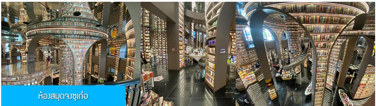
ห้องสมุดวงซุก่อ