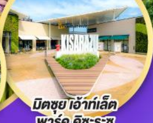
มิตซูโฮะอิเกะอิชิอิชิ พาร์ค คิชะระชู