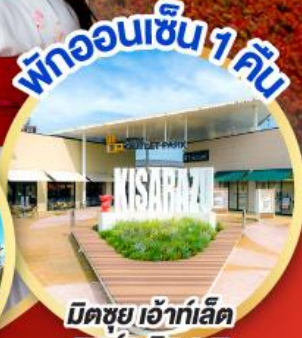
มิตซุยะ เอ้าท์เล็ต พาร์ค คิชะระชู