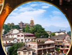
เมืองโบราณฉือจี้เป่