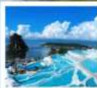
ซานโตรินี่ต้าหลี่

“เกาะเสี่ยวผู่...เกาะลึกลับกลางทะเลสาบ เอ้อไห้”