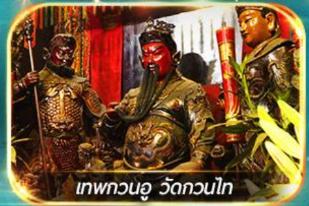
เทพกวนอู วัดกวนไท

พามุไหว้พระขอพร 8 วัดดัง, อิสระช้อปปิ้ง 1 วันเต็มแบบจุใจ