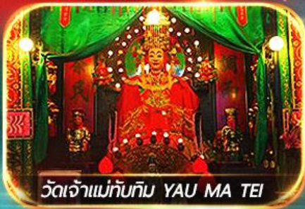
วัดเจ้าแม่ทับทิม YAU MA TEI