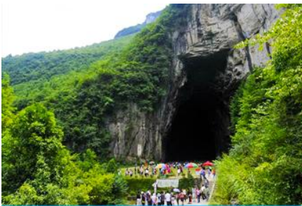
ถ้ำพญามังกร