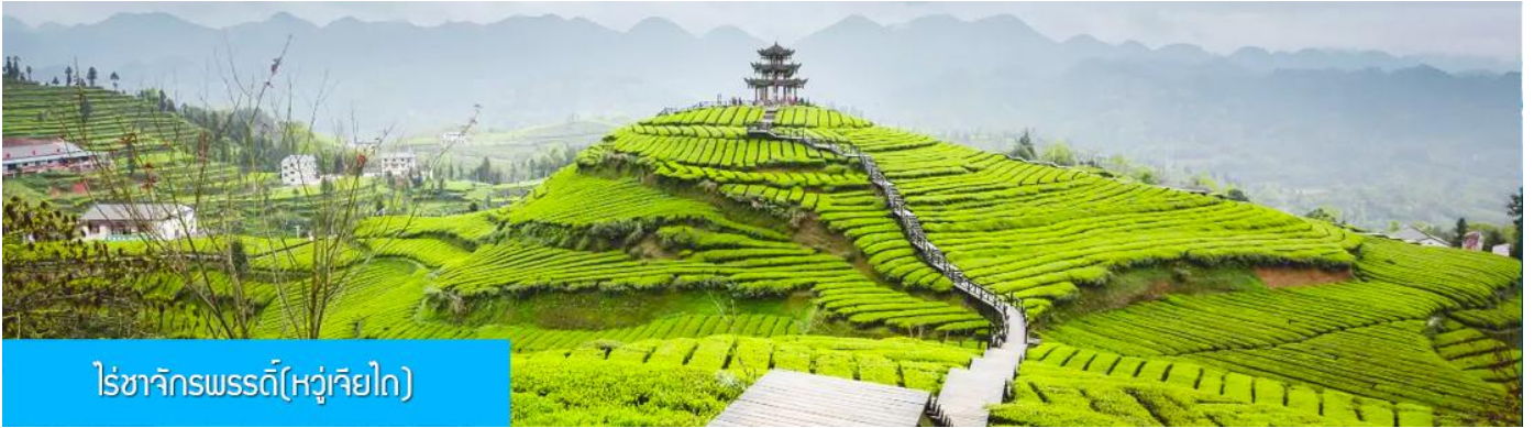
ไร่ชาจักรพรรดิ(หู่เจียไถ)

เช้า รับประทานอาหารเช้า ณ ห้องอาหารของโรงแรม (4)