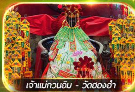
เจ้าแม่กวนอิม - วัดฮ่องกง