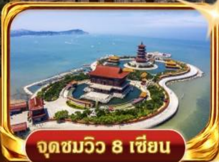
จุดชมวิวกว 8 เซียน