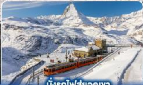
นั่งรถไฟสุดอลเวง กรอนเนอร์เกรต