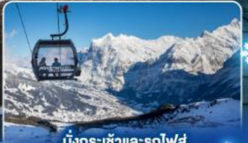
นั่งกระเช้าและรถไฟสุด อลเวงจากจูเนรา