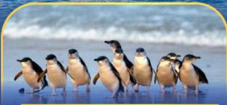
พาเหรดนกเพนกวิน