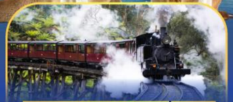
รถไฟพัพฟิงบิลลี่

ล่องเรือชมอ่าวซิดนีย์พร้อมรับประทานอาหารกลางวัน และ เข้าชมสวนสัตว์การองก้า