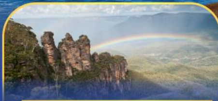
อุทยานแห่งชาติบลูเมาท์เทนส์ Three Sister Rock