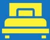
ห้องพักเดี่ยว SINGLE

ตัวอย่างประเภทห้องพัก *เป็นเพียงตัวอย่างเพื่อให้เห็นภาพสำหรับประเภทห้องในแบบต่างๆ