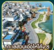
ทะเลสาบเอ๋อไห่คัง S