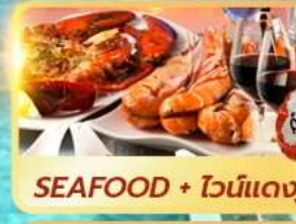
SEAFOOD + ไวน์แดง