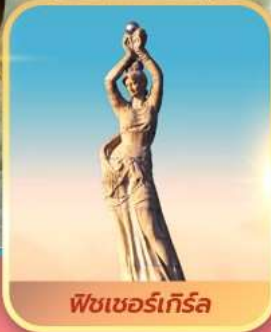
พีชเซอร์เกิร์ล