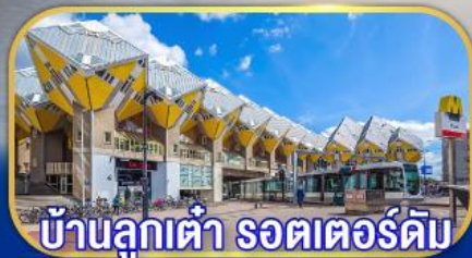
บ้านลูกเต่า รถเตอร์ดัม

เยือนเมืองเก่าแก่ยุโรป ทั่วมหาสมุทรแอตแลนติก กับการบินไทย บินตรงอัมสเตอร์ดัม