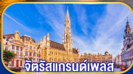
จัตุรัสแกรนด์เพลส