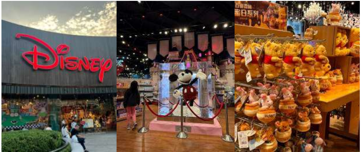
หญิงดิสเนย์ ให้ท่านช้อปปิ้งเป็นของฝากที่ระลึก

จากนั้นนำท่านสู่ Disney Flagship Store (Lujiazui) เป็นแหล่งรวมตัวละคร ดิสเนย์ แบบถูกลิขสิทธิ์ ที่มีขนาดใหญ่กว่าในสวนสนุก Disney land มีคาเรคเตอร์ตัวละครมากกว่า 2,000 รายการ เช่น มิกกี้ มินนี่ และเจ้า