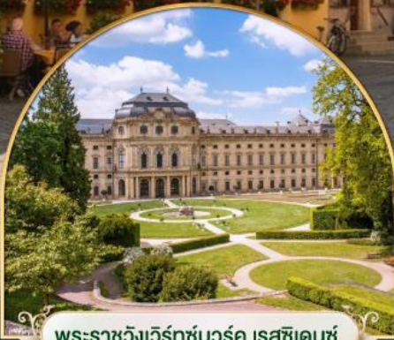
พระราชวังเวิร์ทซ์บวร์ค เรสซิเดนซ์