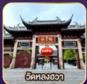
วัดหลงอวา