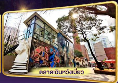
ตลาดเงินหวังเมียว