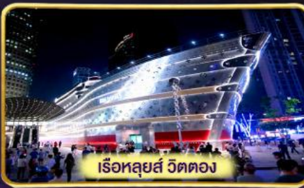
เรือหลุยส์ วัดตอง