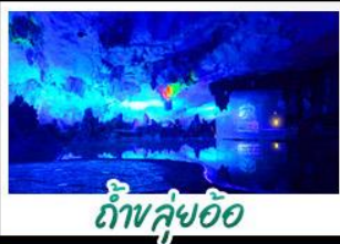
ถ้ำหยู้อ้อ

เขารู้อี+สะพานแดง - ล่องเรือแม่น้ำหลี่เจียง นาขั้นบันไดสีทองอร่าม - กำแพงหยู้อ้อ - เขาวงกต เจดีย์เงินเจดีย์ทอง - รถไฟความเร็วสูง เบบูพิเศษ บุฟเฟ่ต์บาร์บีคิว ปลาอบเบียร์ เฝือกคริสตัล สุกี้เท็ด