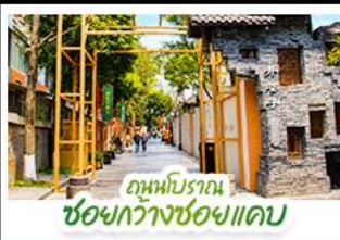
ถนนโบราณ ชอยกวางชอยแคบ