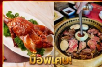
เปิดอย่างฮ่องกง บูฟเฟต์ปิ้งย่างเกาหลี