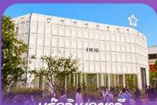
นริ๊กอินกาหลี่