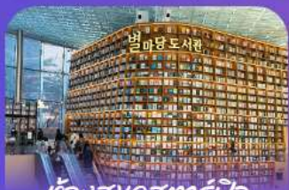
ตึกสมุดคตาร์ทฟิค

เก็บทุกไฮไลท์ ในกรุงโซล ตั้งแต่ความงามของ พระราชวังเคียงบ็อก ชมวิวสุดอลังการที่ คิกลอคเค็ต โซลสกาย (รวมค่าลิฟต์ขึ้นตึก) สนุกสุดมันส์ที่ สวนสนุกลอคเค็ต เวิร์ล (รวมค่าบัตรเครื่องเล่น) เพลิดเพลินไปกับโลกใต้ทะเล ล็อดเต้อควาเรียม (รวมค่าบัตรเข้าชม) เช็กอินแลนด์มาร์กสุดฮิตอย่างห้องสมุดสตาร์ฟิช โคเอกมอลล์ เดินเล่นย่านฮิป นริ๊กอินกาหลี่ ซองชุง และช้อปปิ้งซัมเมอร์ซอล สูดฟิน ย่านเมืองคงและฮงแด