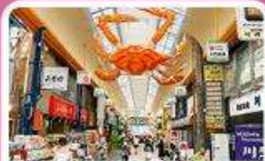
ตลาดคุโรงะ

เดินทาง 03 - 07 ก.ค. 69 | 19 - 23 ส.ค. 69 | 25 - 29 ก.ย. 69