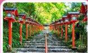
ศาลเจ้าคิฟูเนะ