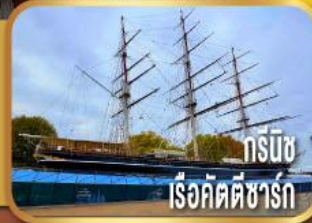
กรีนวิช เรือคัตตีซาร์ก

ชมเมืองลิเวอร์พูล พร้อมถ่ายรูป หน้าสนามแอนฟิลด์