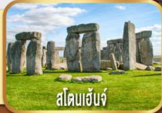
สโตนเฮ็นจ์