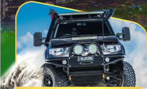
คันรถ 4WD สู่ใจกลางเทือกเขาคอเคซัส