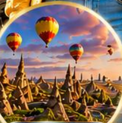
เมืองคปปาโดเกีย Cappadocia