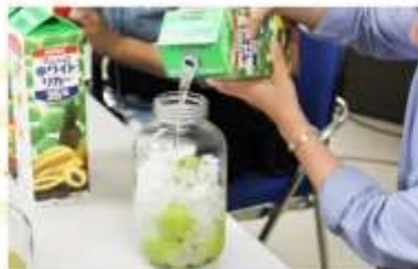
UMESHU MAKING AT NAKANO BC