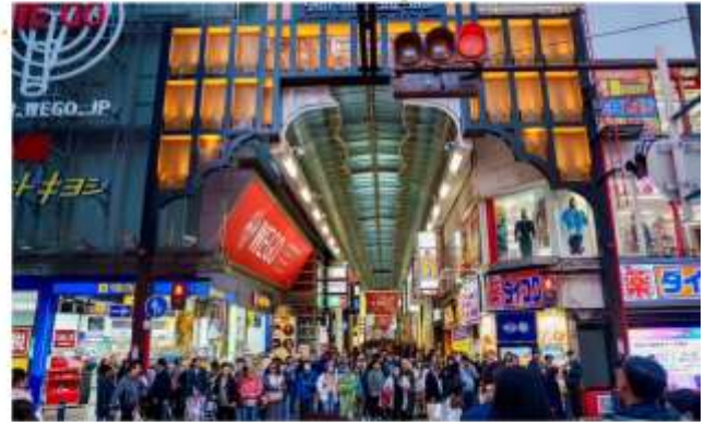
อีสร-อาหารกลางวันตามอียาคี (ไม่รวมในรายการ)