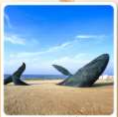
วาฬผู้โตดเดี่ยว