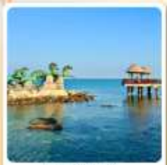
เกาะหยางหม่า