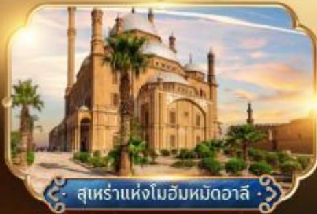
สุเหร่าแห่งโมฮัมหมัดอวาลี