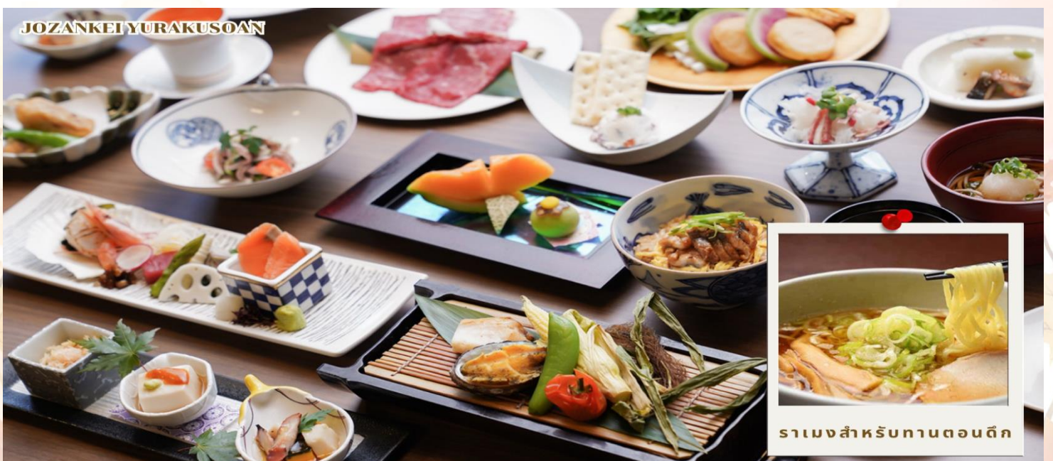
ราเม็งสำหรับทานตอนดึก

ค่ำ รับประทานอาหารค่ำ ณ ห้องอาหารของโรงแรม (มื้อที่ 5)