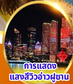
การแสดงแสงสีว้อว่่าผู้ซาน