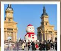
ตึกตาคิม-ยักซ์