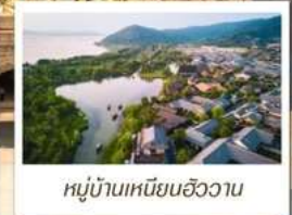
หมู่บ้านเหนียนฮิววาน

🧳 โหลด 23 KG. x1 ทั้งไป - กลับ ✓ พรีเมียมทิวทัศน์ ✓ ไม่เข้าร้านรัฐบาล ✓ ทิวทัศน์แปลก ✓ รวมค่าเข้าชมสถานที่ตามโปรแกรม