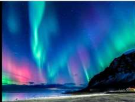
***รูปภาพเพื่อประกอบการโฆษณาเท่านั้น***