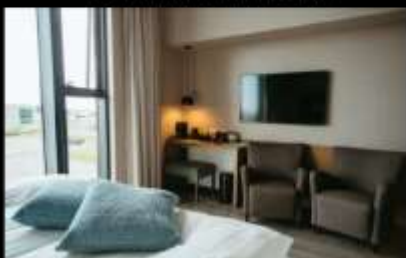
HOTEL VÍK Í MÝRDAL

นำคณะพัก Hotel Vík í Mýrdal หรือ Black Sand Hotel หรือเทียบเท่าในระดับเดียวกัน คำคืนนี้ท่านสามารถล่าแสงเหนือได้จากที่พักโรงแรม NORTHERN LIGHT (AURORA BOREALIS) เป็นปรากฏการณ์ที่เกิดขึ้นตามธรรมชาติในเขตบริเวณขั้วโลกเหนือในกลุ่มประเทศที่อยู่เหนือเส้นอาร์กติก เซอร์เคิล โดยมีประเทศไอซ์แลนด์รวมอยู่ด้วย มักจะพบเห็นได้ทั่วไปเนื่องจากเป็นแสงที่มาจากชั้นบรรยากาศเหนือพื้นโลกไปราว 100-300 ก.ม. โดยจะเห็นได้ชัดเจนในช่วงเวลาฟ้าเปิด และอยู่ในระหว่าง เดือนกันยายน-เดือนเมษายน ของทุกปี